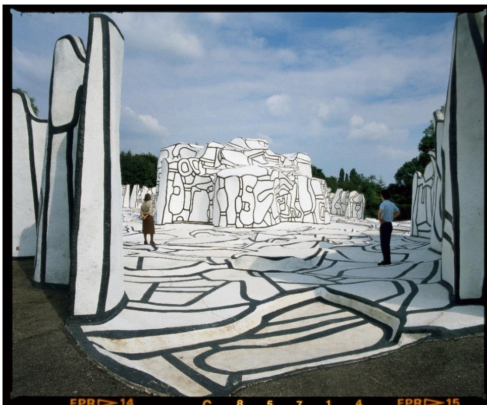
< La Closerie Falbala (1971-1976)

Une carte des sculptures monumentales de Jean Dubuffet est disponible sur le site tourauxfigures.hauts-de-seine.fr .